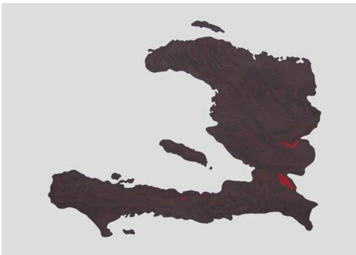
Serie Mapas de piel (Haiti) . Acrílico sobre papel, 50x70 cm, 2013

Lejos de estas proyecciones canónicas ligadas a una mirada colonizadora y presuntamente científica, la artista evidencia el carácter epidérmico y superficial de todo sistema cartográfico. El mapa, artificio figurativo con pretensión de espejo, suele excluir más de lo que incluye (algo queda siempre al margen, invisible, ausente), quizá como ardid para liberarse de la ansiedad que genera lo diferente –así lo señala Estrella de Diego ( Contra el mapa )–, sin embargo, la diferencia no habita en la piel y sus colores, de cerca, terminan por parecerse todos. Mientras en un mapa convencional el relieve se oscurece a medida que se incrementa la altura y las particularidades desaparecen, en estas cartografías la piel se ennegrece conforme aumenta la distancia (física, pero también moral) y se enfatizan las diferencias. Rosalía Banet realiza un ejercicio de acercamiento –zoom del cuerpo– alterando las escalas aprendidas para mostrar una geografía de superficie, la de nuestra propia envoltura, que muestra sus heridas y sangra. Abolidas las coordenadas tradicionales, la referencia espacial queda en suspenso para ofrecer una anatomía topográfica que evidencia la fragilidad y vulnerabilidad del sistema que hemos creado.