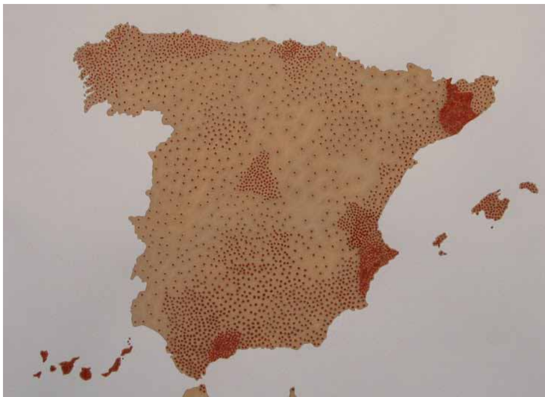
Cartografías del dolor de España (suicidios). Acrílico y lápiz sobre papel, 70×100 cm, 2012

Pero por mucho que el llamado primer mundo se esfuerce por disfrazar sus imperfecciones, las heridas acaban saliendo a la superficie. Un mapa de España con la piel enferma enseña de nuevo una serie de ampollas y pústulas que se corresponden con el número de suicidios –más de tres mil en 2010, según datos del INE– ocurridos en nuestro país a consecuencia de la crisis.