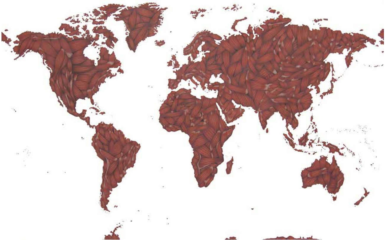
Mapa mundi desollado. Acrílico y lápiz sobre papel, 120x200 cm, 2013

En una de sus fábulas más conocidas, Borges imaginó un imperio donde el arte de la cartografía había logrado tal nivel de perfección y desmesura que llegaron a fabricar “un Mapa del Imperio que tenía el tamaño del Imperio y coincidía puntualmente con él”. La distancia había sido abolida y el territorio real igualaba su representación.