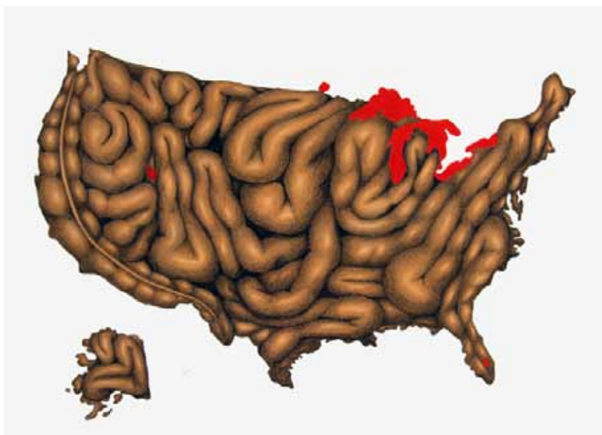
Serie Black stomach (USA) . Acrílico y lápiz sobre papel, 50x70 cm, 2013

Frente a este mural de pieles pobres, la artista dispone otro que le sirve de contrapunto dialéctico, pero esta vez con los mapas de los quince estados más ricos del mundo. Aquí la representación va más allá de la piel para dejar las tripas al descubierto y también algunas de sus úlceras. La serie lleva por título "Black Stomach", expresión que en japonés ( hara-guro ) se aplica a personas infames (habitualmente políticos, empresarios y banqueros) que intentan ocultar algo, indiferentes ante el dolor de los demás. Son mapas enfermos que presentan unos intestinos ennegrecidos, teñidos de un color rancio, sucio, casi podrido, retrato de una sociedad opulenta, marcada por la sobreabundancia y el exceso.