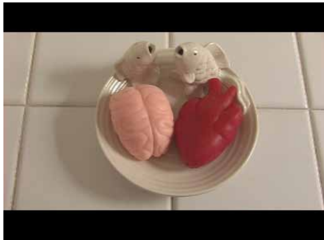
Doble erosión. DVD, 4' 40", 2013

Por último, un mapamundi minuciosamente desollado. El adentro reconvertido en afuera, dejando a la vista los nervios y la musculatura para descubrir un cuerpo troceado, fragmentado, desmembrado que señala sus cotas más altas en forma de huesos y tendones, haciendo del planeta el trasunto de un moderno Prometeo condenado al suplicio de ser eviscerado, mientras la humanidad, igual que su hermano Atlas, carga a la espalda con el peso del mundo ignorando la manipulación a la que está siendo sometida. En este sentido, el vídeo “Doble erosión” no puede ser más contundente: unas manos lavan –o más bien se lavan– el cerebro y el corazón hasta quedar reducidas a dos pequeñas esferas que han perdido sus rasgos, al compás de unas campanas que doblan a muerte.