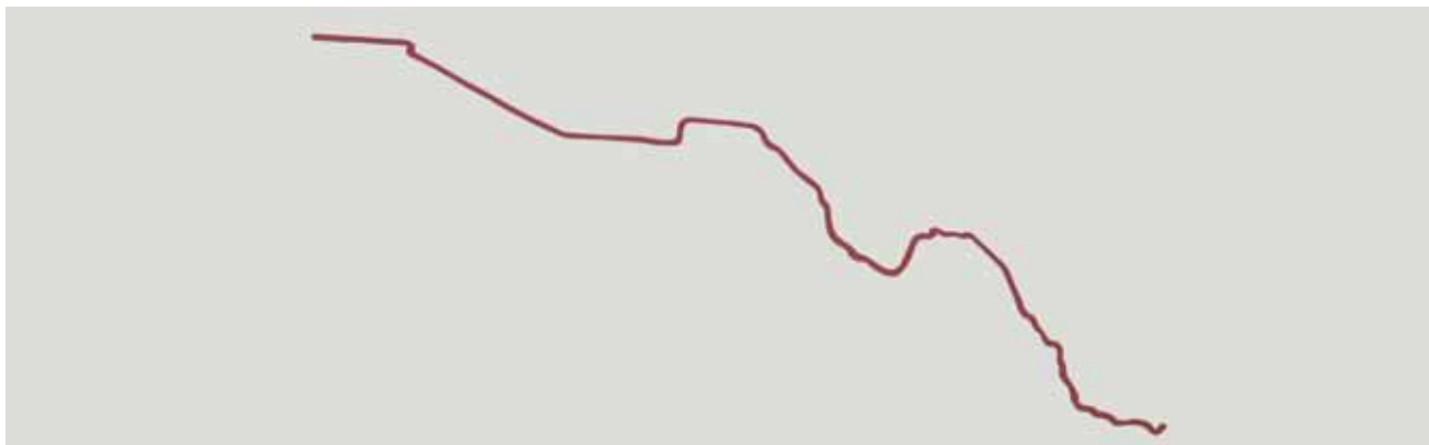
Serie Fronteras de sangre (USA-Mexico). Acrílico y lápiz sobre papel, 37x110 cm, 2013

Entre tanto, las líneas de sutura que marcan el límite artificial entre dos formas de vida se rompen dibujando un reguero de sangre (la frontera entre Estados Unidos y México, en este caso) o una gran salpicadura roja (la del mar interior que separa Europa de África), alimentadas cada día por las personas que mueren o desaparecen en busca de una vida mejor.