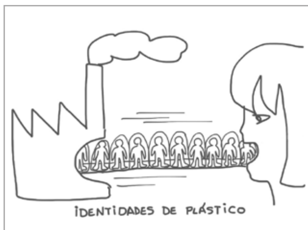
Sin título ( Plastic identities ). Dibujo digital, 15x19cm, 2013

Rosalía Banet muestra cómo unos países engordan desmesuradamente mientras otros adelgazan hasta el pellejo. Una serie de dibujos digitales completan esta visión crítica hacia una sociedad de consumo fabricada a partir de identidades clonadas que en su delirio por tener más y más ha conseguido que las enfermedades producto de la desnutrición hayan dado paso a trastornos y patologías derivadas de la sobrealimentación o de una nutrición inadecuada.